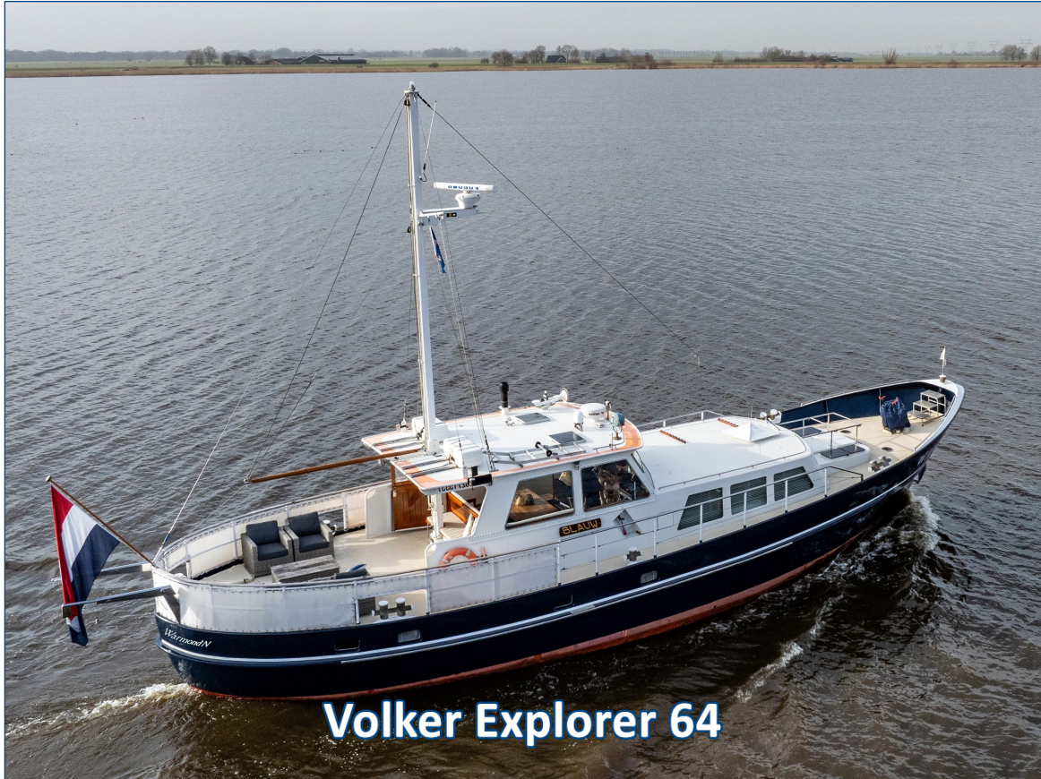
Volker Explorer 64